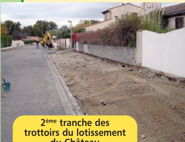
2 ème tranche des trottoirs du lotissement du Château