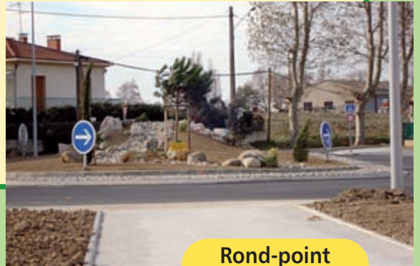
Rond-point du lycée