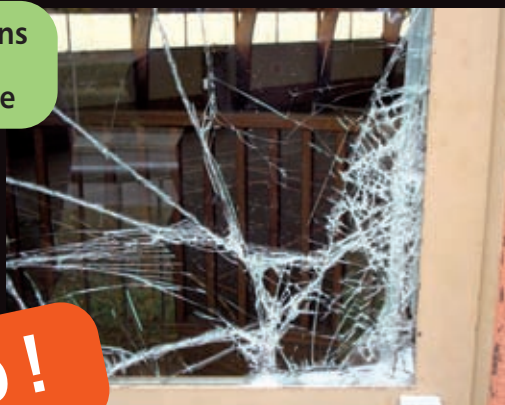
Dégradations salle polyvalente