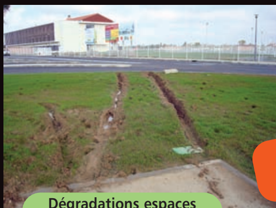
Dégradations espaces verts du Lycée