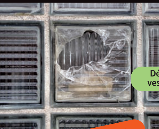
Dégradations aux vestiaires du foot...