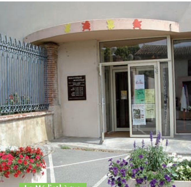
La Médiathèque aujourd'hui