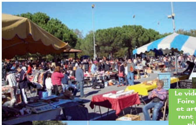
Le vide-grenier et la Foire commerciale et artisanale attirent une foule de plus en plus nombreuse

Toute l'équipe du Comité des fêtes vous présente ses meilleurs vœux pour 2008.