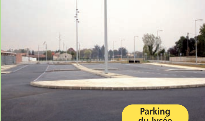
Parking du lycée