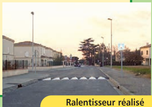
Ralentisseur réalisé chemin de la Croisette