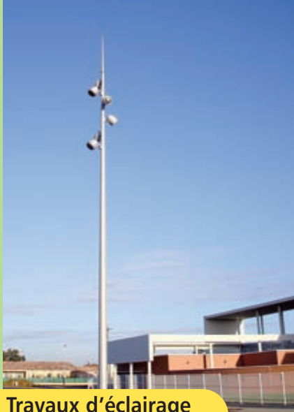
Travaux d'éclairage du lycée