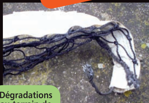
Dégradations au terrain de tennis