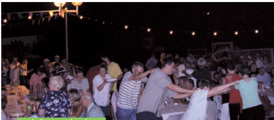
le "Cassoulet de Justaret", une soirée très animée

Le 3 ème dimanche d'octobre, les chineurs ont rendez-vous avec Pins-Justaret. Le vide-grenier et la Foire commerciale et artisanale attirent