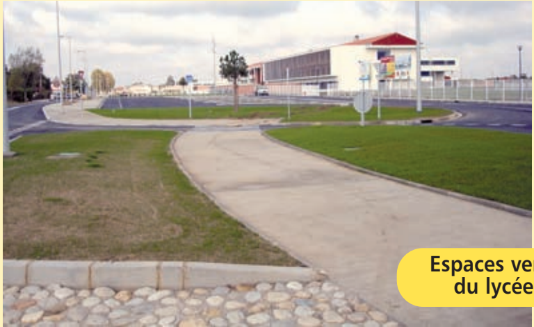
Espaces verts du lycée