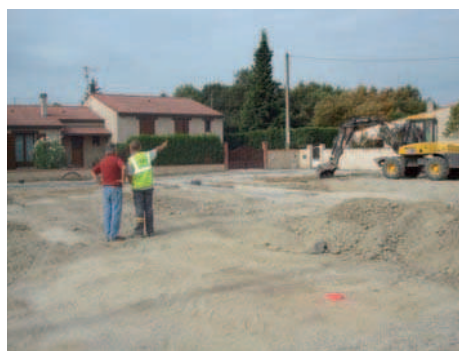
Impasse du Château .....