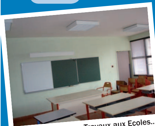
Travaux aux Ecoles...