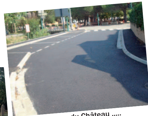
Impasse du Château .....