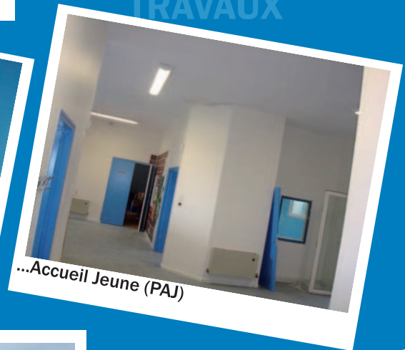
...Accueil Jeune (PAJ)