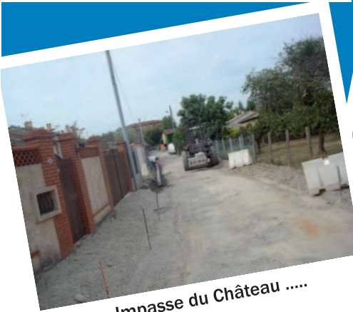
Impasse du Château .....