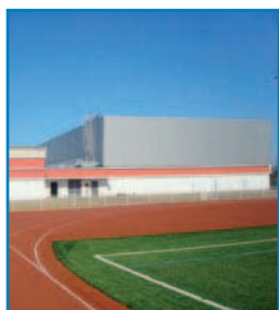
Couverture : Complexe Sportif