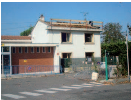
Travaux de la Poste