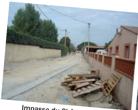
Impasse du Château .....