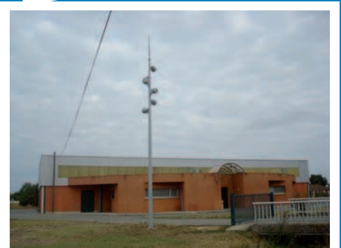
Eclairage Halle des Sports