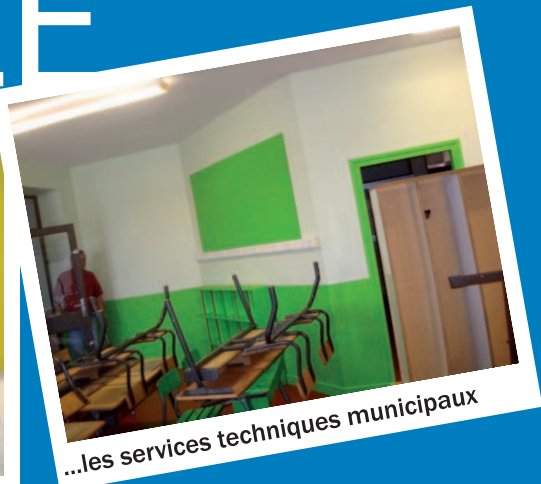
...les services techniques municipaux