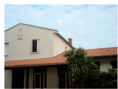
Toiture du PAJ