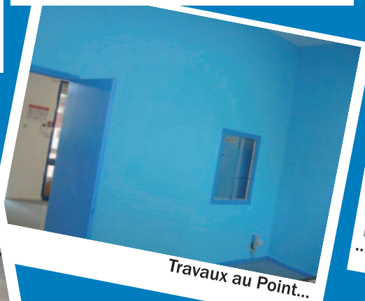
Travaux au Point...