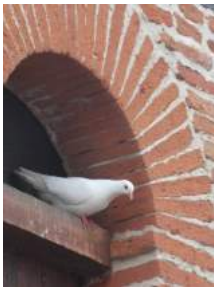
Habitant du pigeonnier du château

Hormis « ce pigeonnier du pauvre », Pins-Justaret possède neuf pigeonniers, localisés principalement dans deux zones géographiques : le centre du village et le quartier de Justaret. Au centre du village, nous dénombrons trois « pied de mulet » (rue de la Bourdasse, à côté de l'église, à Figarèdes), un pigeonnier intégré dans une maison d'habitation de la rue Sainte Barbe et bien sûr, le pigeonnier quadrangulaire du château qui reste le plus emblématique.