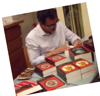
Rencontre avec l'écrivain Victor del Arbol le 6 octobre