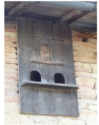
le pigeonnier du pauvre chemin de la Cépette

En tournant légèrement la tête à droite, le passant quittant la place Ste Barbe et se dirigeant vers le rond point de Cordignano l'aperçoit aisément. Il s'agit d'une petite planche de bois ajourée sous le toit de la maisonnette en contrebas de l'église. C'était le « pigeonnier du pauvre ». En effet, le droit de colombier variait selon les provinces. Seuls les seigneurs hauts justiciers pouvaient posséder des pigeonniers à pied, construction séparée du corps de logis principal. Dans certaines provinces, était appliqué le principe de la censive (1). Dans ce cas précis, le seigneur n'avait droit au colombier que s'il possédait des terres concédées au titre d'un bail à cens. Jusqu'à la nuit du 4 août 1789, les paysans ne pouvaient posséder de pigeonniers. Or la viande de pigeon présente plusieurs avantages : la rapidité de croissance du volatile, le peu de nourriture nécessaire, la viande fournie ou l'argent procuré par sa vente sur les marchés. A la fin du XVIIème siècle, les plus modestes construisaient donc la loi et élevaient les pigeons dans le grenier ou construisaient un volet (petite construction de bois), sur un pan de mur extérieur du logis principal comme en témoigne la photo prise chemin de la Cépette.