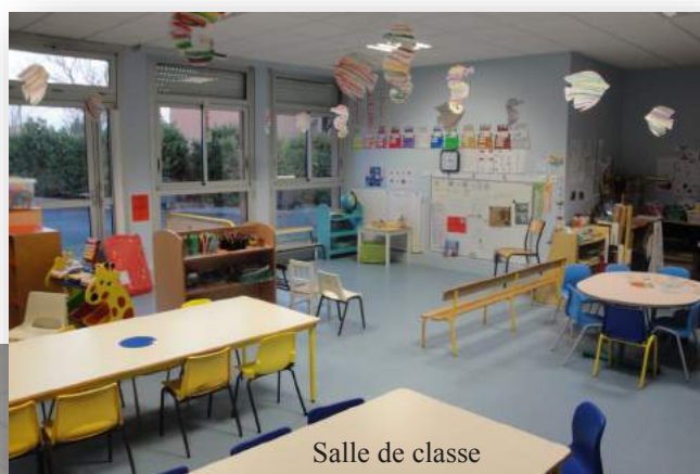
Salle de classe