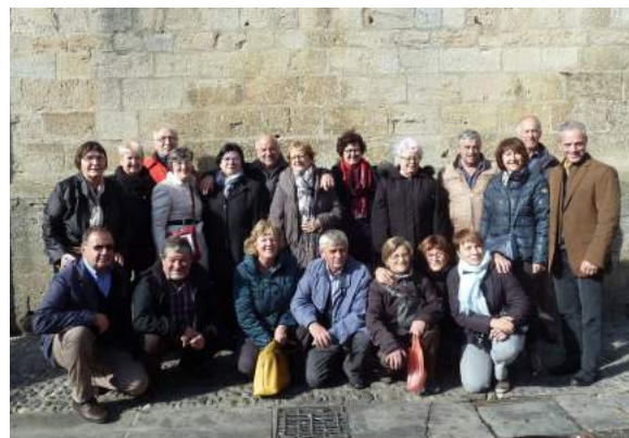
La délégation en visite de Mirepoix

Le lendemain nos amis ont été invités à faire une balade très appréciée à Mirepoix dans l'Ariège, où se déroulait la « fête de la pomme ». Un grand merci à tous ceux qui nous ont aidés aussi bien dans l'accueil de nos amis que dans le service du repas.