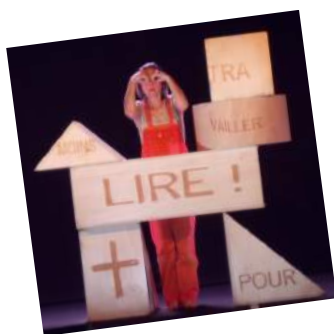
L'île Turbin, spectacle tout public le 7 novembre