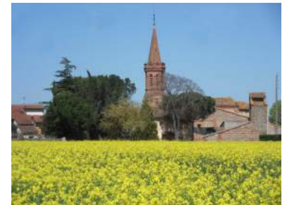
Brique et or

Les pigeonniers dans la revue de la Société du Patrimoine du Muretain : revue n° 7 – 2004 les pigeonniers à Villate ; revue n° 9 - 2006 les pigeonniers de Pins-Justaret ; revues 14 et 17 : 2011 et 2015 les pigeonniers à Muret .