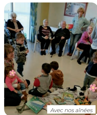
Avec nos aînées