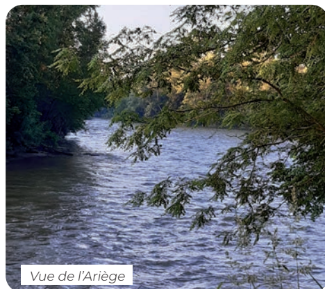
Vue de l'Ariège