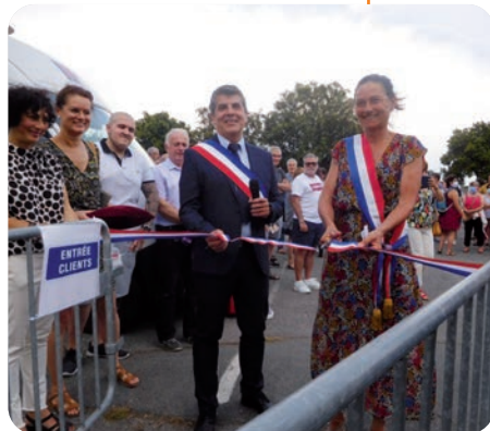
Inauguration du marché