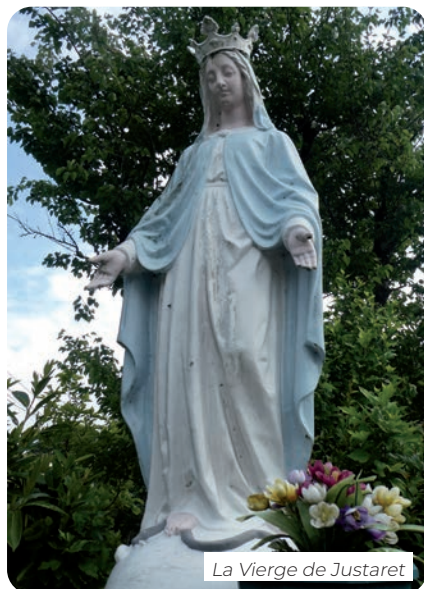
La Vierge de Justaret