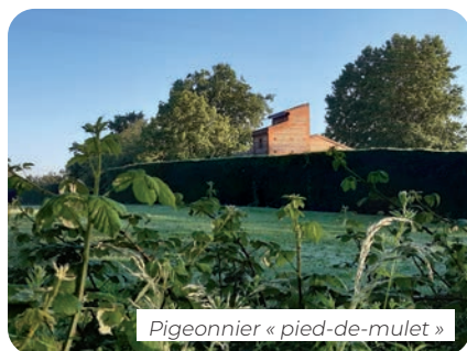
Pigeonnier « pied-de-mulet »