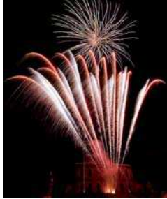
Couverture : Feu d'artifice 2010