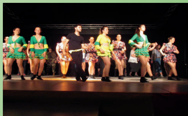
Spectacle des associations culturelles 26 mai 2018