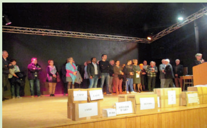
Remise des dotations aux écoles des associations 26 janvier 2018