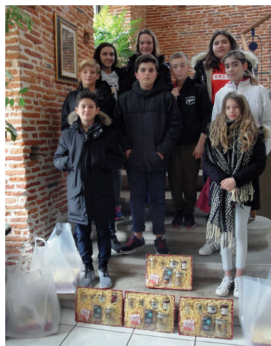
Distribution des colis de Noël aux aînés le 16 décembre