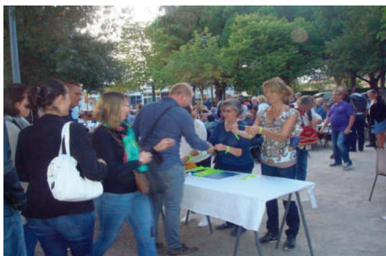
Le cassoulet Place René Loubet