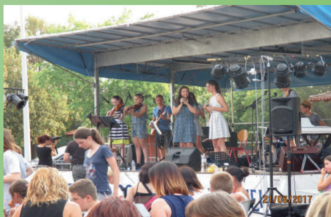
Fête de la musique 21 juin 2018

Pour recevoir l'agenda de toutes les manifestations mensuellement par mail, envoyer un mail à l'adresse: contactinfo@mairie-pinsjustaret.fr