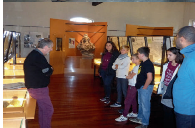
Musée de la Résistance et de la Déportation le 08 novembre