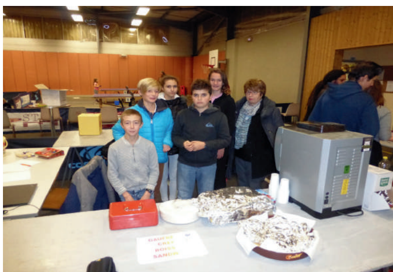
Téléthon le 01 décembre