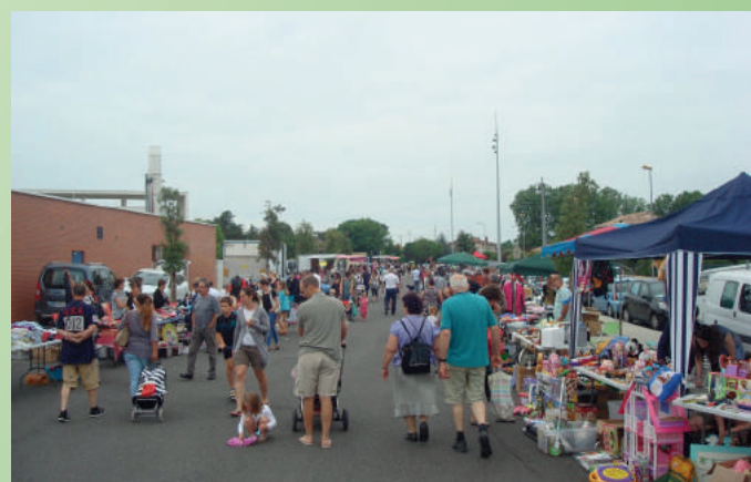
Vide grenier 17 juin 2018