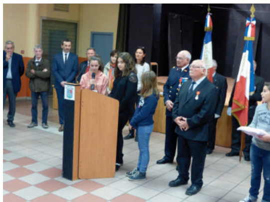
Cérémonie de la remise de la légion d'honneur le 04 novembre