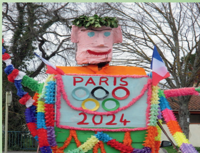
Carnaval mars 2018