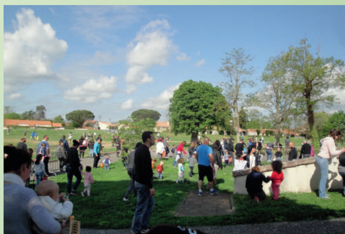
Chasse aux œufs 1 er avril 2018